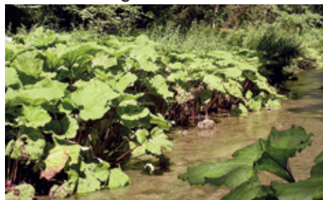
Pestwurz fühlt sich auf feuchten Standorten wohl

Die Pestwurz ist zweihäusig – das heißt, es gibt männliche und weibliche Pflanzen. Die Blütenstände bestehen aus zahlreichen kleinen, eher unscheinbaren weiß-rosa Röhren- und Zungenblüten, die den ers-