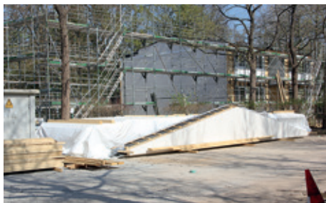
Unterkunft im Bau

Im Juni 2024 berichteten wir von den Plänen der Sozialbehörde, auf dem Parkplatz des Klein-Flottbeker Botanischen Gartens eine Flüchtlingsunterkunft zu errichten. Sie soll für 144 Menschen in zweistöckigen Containerhäusern vorgesehen sein. Hauptsächlich wird dabei an Familien gedacht. Nun sind erste Bauten im Entstehen. J. Pfuhl