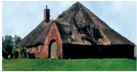
Kleiner Haubarg mit zerstörtem Reetdach.

Die Pfeife ist zu Ende geraucht. Er stopft sich eine zweite. Er kann noch nicht zu