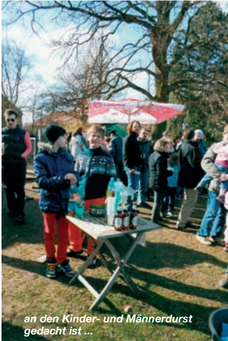
an den Kinder- und Männerdurst gedacht ist ...