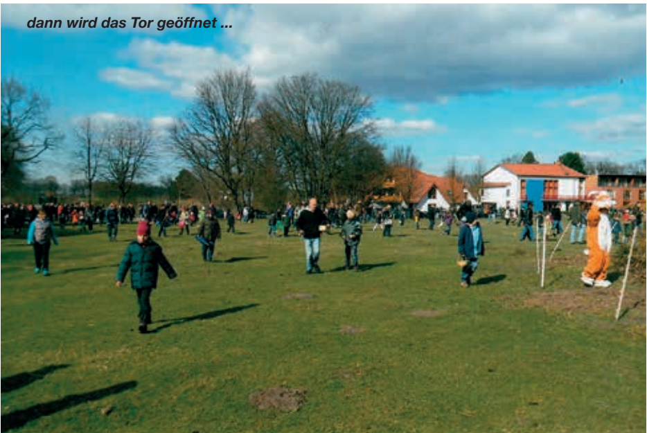
dann wird das Tor geöffnet ...