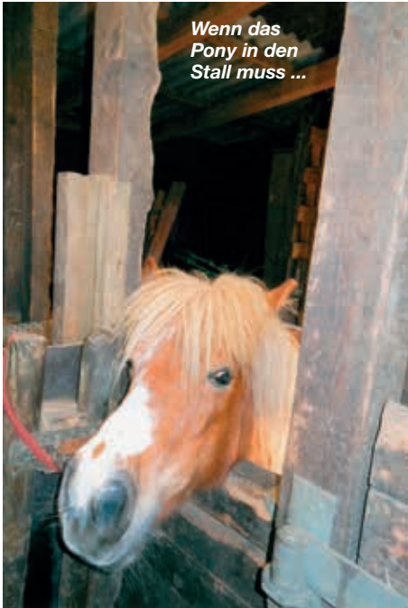
Wenn das Pony in den Stall muss ...