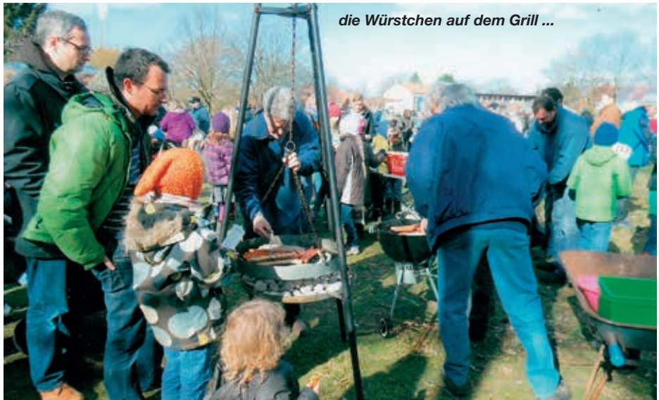
die Würstchen auf dem Grill ...