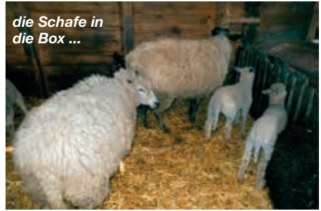
die Schafe in die Box ...