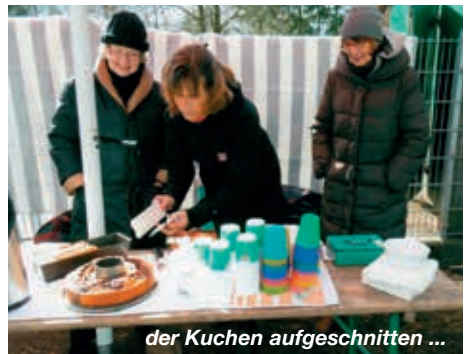
der Kuchen aufgeschnitten ...