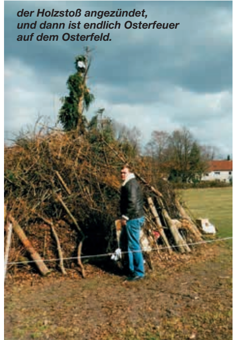
der Holzstoß angezündet, und dann ist endlich Osterfeuer auf dem Osterfeld.