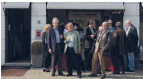
Die Jubilare beim Empfang

Seit 1978 hatten die beiden Partner in Wandsbek zusammen als Angestellte gearbeitet und sich dort kennen und schätzen gelernt. Nachdem jeder seine eigenen Wege gegangen war, arbeiteten sie in einem Optikergeschäft in Othmarschen wieder zusammen. Und dann in 1992 die gemeinsame Selbstständigkeit.