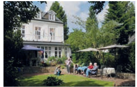
Nette Klön-Runde im Garten