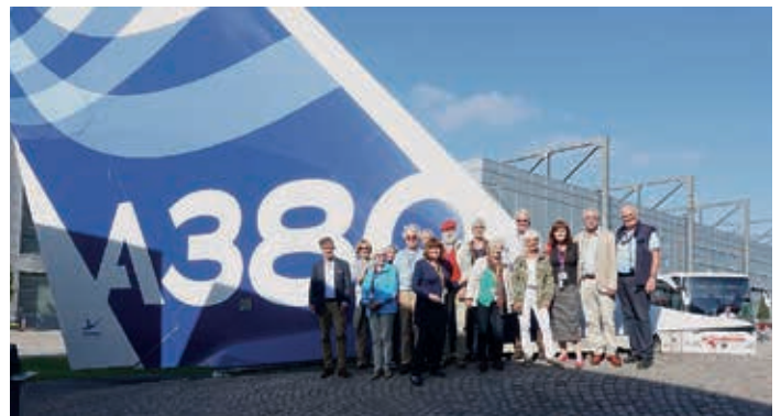
Die Besucher des Bürger- und Heimatvereins Nienstedten